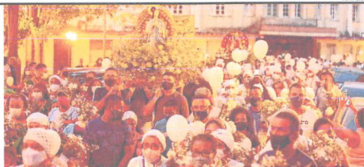
Além do aniversário da cidade, cortejo dos Orixás também homenageou dom Luís Rei de França e Nossa Senhora da Vitória e da Conceição

Evento tradicional de matriz africana percorreu ontem as ruas do Centro Histórico de capital; já a missa foi celebrada na Catedral Metropolitana. CIDADES 6