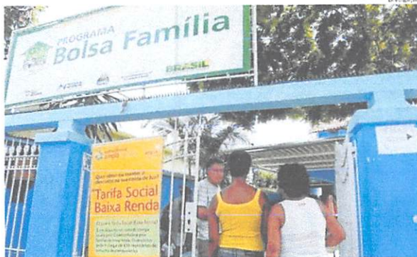
Bolsa Família seria substituído por novo programa federal de transferência de renda para o país

A intenção do governo é alterar os parâmetros para definição de pobreza e extrema pobreza para incluir mais pessoas no programa. A proposta enviada ao Congresso no mês passado reformula o Bolsa Família,